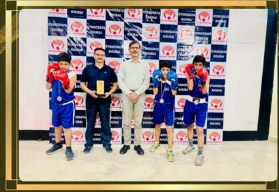
SGFI STATE LEVEL BOXING CHAMPIONSHIP